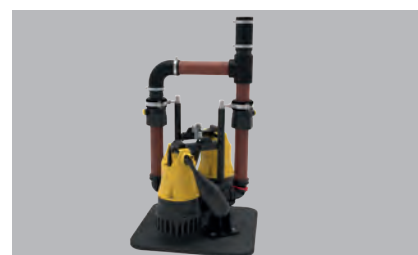
Pumpen nicht im Lieferumfang