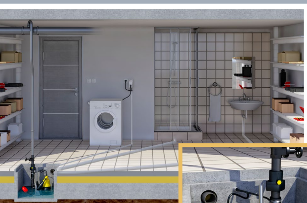
AG10 - Alarmgeber mit Kugeltauchschalter für Pumpenschächte