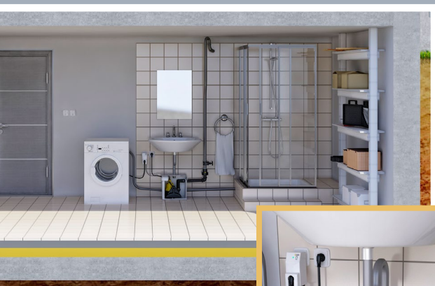
AGR - Alarmgeber mit Reedkontakt für Hebeanlagen (Hebefix)